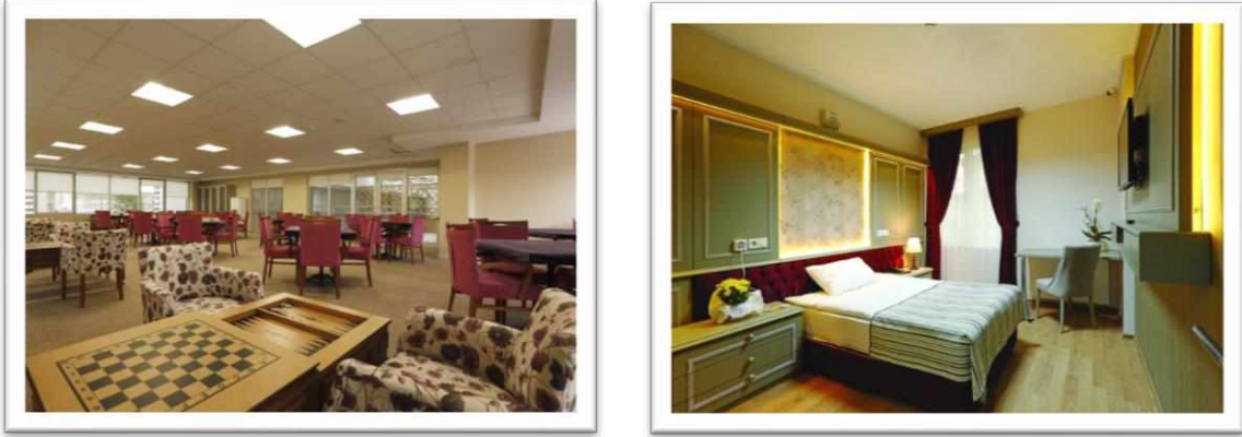
Görsel 1. Ihlamur Konağı Huzurevi / Ankara 1

Türkiye’de bulunan huzurevlerine iyi bir örnek de İstanbul’da bulunan Özel Vip Hayat Huzur Evi ve Yaşlı Bakım Merkezi’dir. Bu kurum 55 yaş ve üzeri yaşlı bireyleri kabul etmekte ve sağlık, sosyal, kişisel bakım gibi tüm ihtiyaçlarını karşılamaktadır. Kurum ayrıca hobi aktiviteleri, müzik eğlenceleri, geziler, açık ve kapalı havuz gibi imkanlarıyla misafirlerine çeşitli imkanlar sunmaktadır (Özel VIP Hayat Huzurevi ve Yaşlı Bakım Merkezi, 2020).